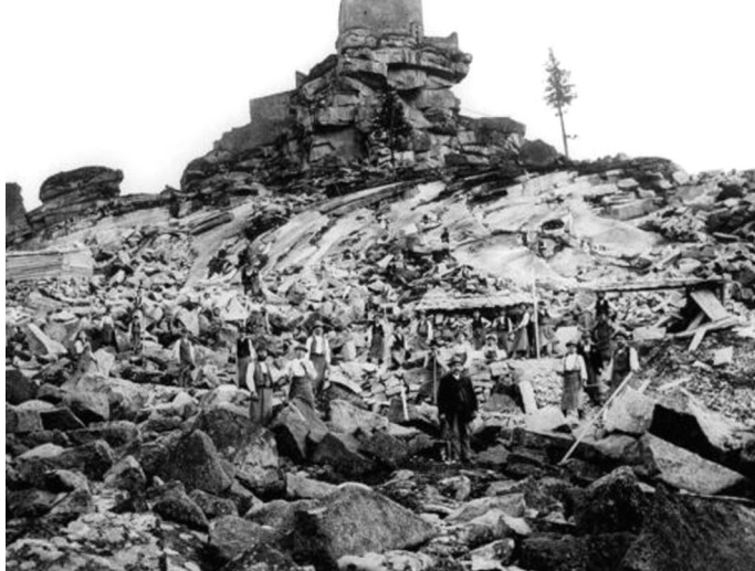
Каменоломня в г. Флоссенбурге.