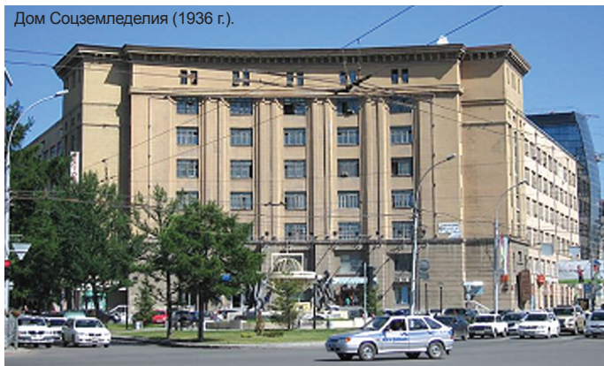
Дом Соцземледелия (1936 г.).