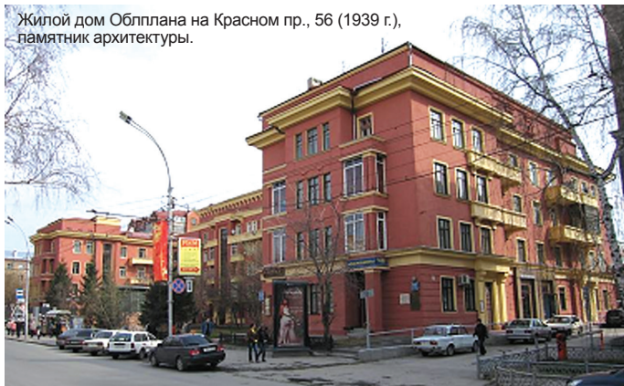
Жилой дом Облплана на Красном пр., 56 (1939 г.), памятник архитектуры.