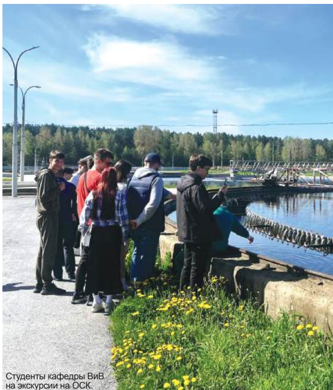
Студенты кафедры ВивВ на экскурсии на ОСК.