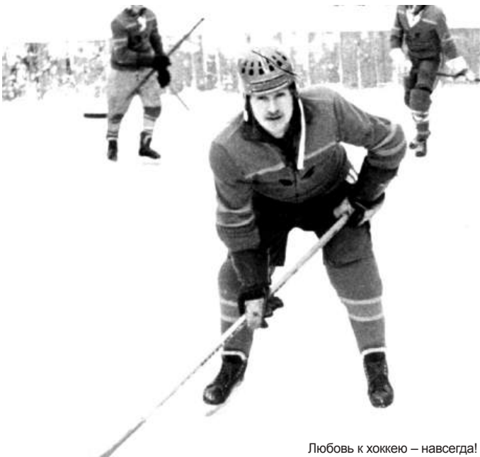
Любовь к хоккею – навсегда!

– Я являюсь депутатом Законодательного Собрания по 17 избирательному округу, который охватывает населённые пункты Мошковского и Новосибирского районов, с общей численностью избирателей более 50 тыс. человек. И моя задача как депутата – сделать жизнь этих людей более комфортной, благополучной и защищённой. В региональном парламенте я занимаю должность заместителя председателя по социальной политике, здравоохранению, охране труда и занятости населения. Эти сферы касаются абсолютно каждого человека, поэтому за-