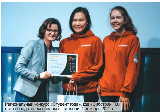
Региональный конкурс «Студент года», где «Сибстрин ТВ» стал обладателем диплома II степени. Сентябрь 2021 г.

Большое спасибо за данную возможность вспомнить и подвести итоги шести лет обучения в университете моей юношеской мечты – НГАСУ (Сибстрин)! К счастью, моё студенчество получилось очень насыщенным. Могу с уверенностью сказать, что с трепетом буду вспоминать эти чудесные дни!