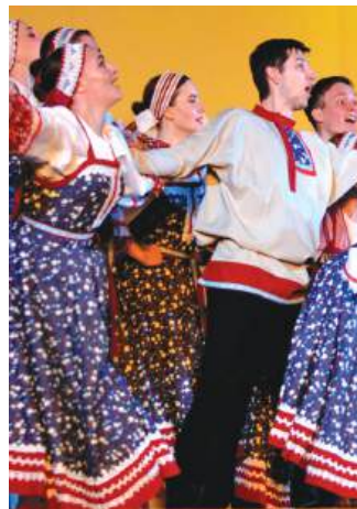
Народный самодеятельный коллектив хореографический ансамбль «Сибирь».

В 2024 г. на базе НГАСУ (Сибстрин) открыты два диссертационных совета: по специальностям «Строительные материалы и изделия (технические науки)» и «Водоснабжение, канализация, строительные системы охраны