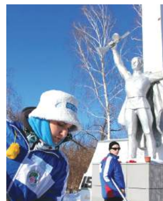
Ежегодная акция «Снежный десант». Бойцы студотрядов ухаживают за памятником участникам Великой Отечественной войны.