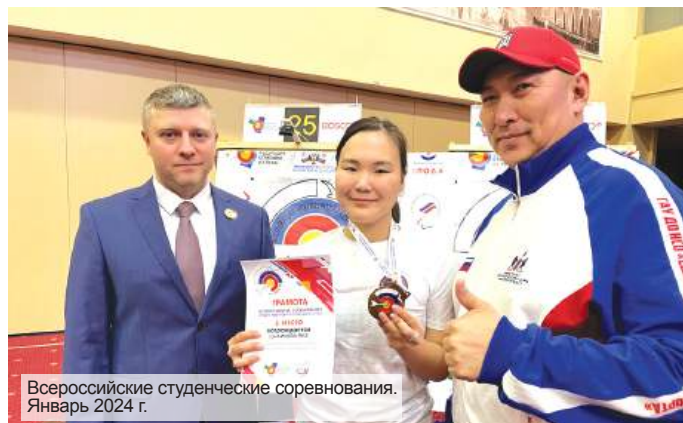
Всероссийские студенческие соревнования. Январь 2024 г.

студенческой конференции (РНСК-2024) «Интеллектуальный потенциал Сибири».