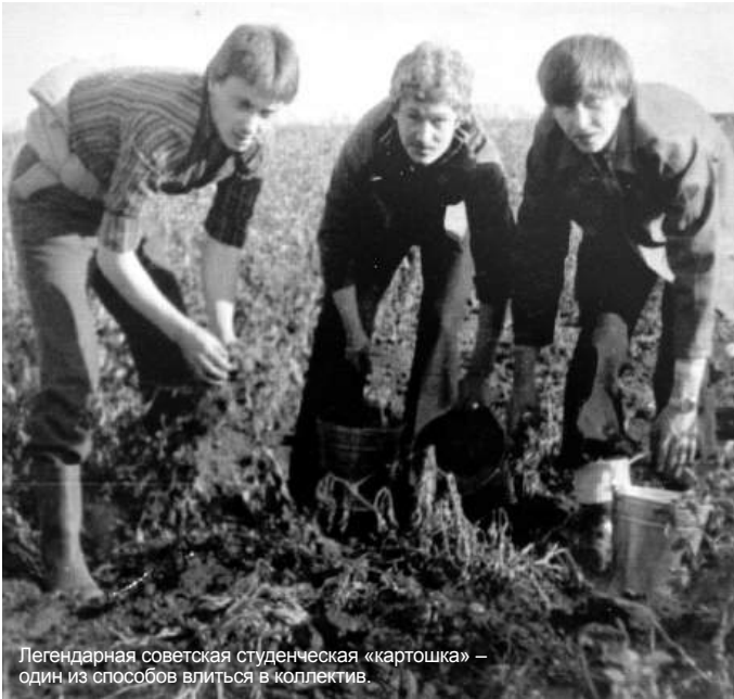
Легендарная советская студенческая «картошка» – один из способов влиться в коллектив.

жения – результат не только твоих природных данных, но и полученного образования, работы педагогов, всего того, без чего ты не смог бы уверенно преодолеть эту профессиональную дистанцию, то тебя не нужно уговаривать помочь. Здесь нужно только найти возможность оказать эту помощь. Я, например, представляю коллектив «Горводоканала». Мы не имеем сверхприбылей, у нас много сложностей. Ежедневно боремся с проблемами отраслевого характера, экономическими, связанными с самой спецификой производства. Но когда люди сталкиваются со сложностями, они становятся более щедрыми.