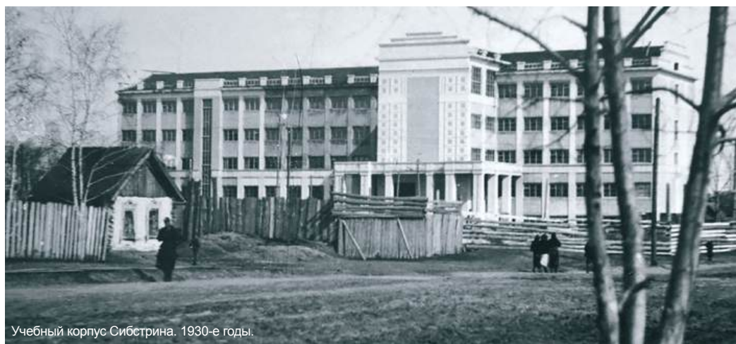
Учебный корпус Сибстрина. 1930-е годы.

Материальная база нового вуза поначалу была весьма слабой, так что институт три года не мог переехать в Новосибирск. Но занятия всё-таки начались 1 сентября 1930 г. в г. Томске. Институт начал готовить архитекторов, инженеров по промышленному и гражданскому строительству, водоснабжению и канализации. На пяти специальностях, отошедших с инженерно-строительного факультета СТИ (фабрич-