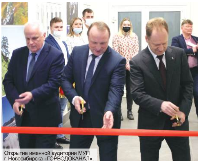
Открытие именной аудитории МУП г. Новосибирска «ГОРВОДОКАНАЛ».