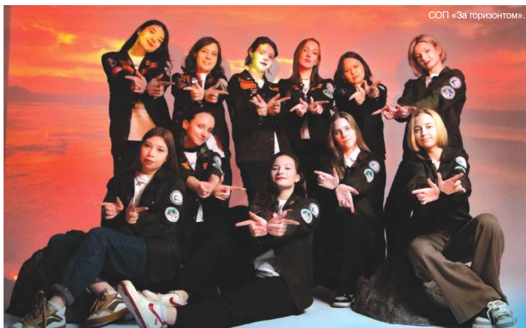
СОП «За горизонтом».