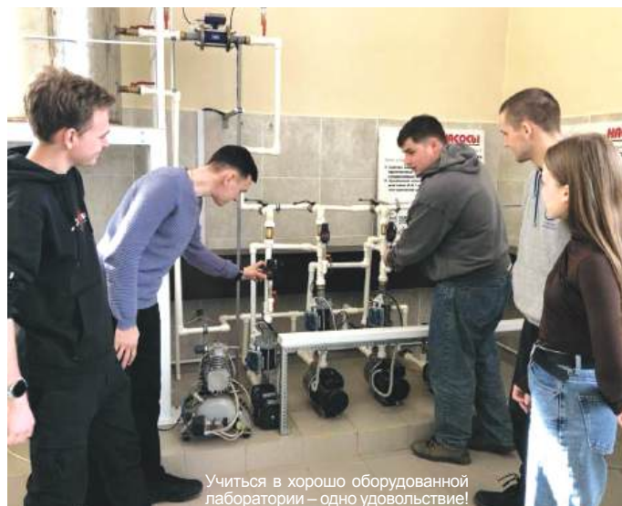
Учиться в хорошо оборудованной лаборатории – одно удовольствие!