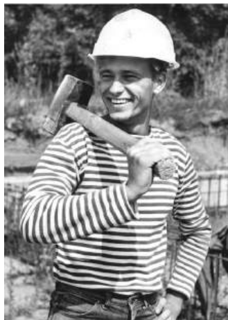
А мне любое дело по плечу!