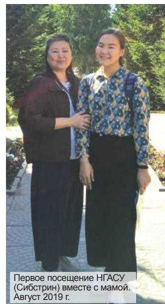
Первое посещение НГАСУ (Сибстрин) вместе с мамой. Август 2019 г.