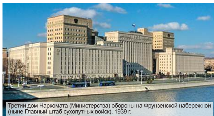
Третий дом Наркомата (Министерства) обороны на Фрунзенской набережной (ныне Главный штаб сухопутных войск), 1939 г.