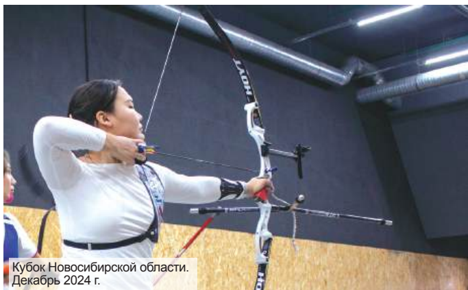
Кубок Новосибирской области. Декабрь 2024 г.