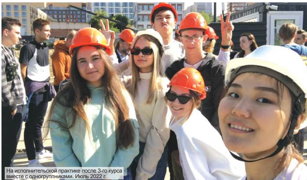
На исполнительской практике после 3-го курса вместе с одногруппниками. Июль 2022 г.

В прошлом году стали обладателями дипломов: I степени Совета молодых учёных университета на 81-й СНТК НГАСУ (Сибстрин); а также II степени на Региональной научной