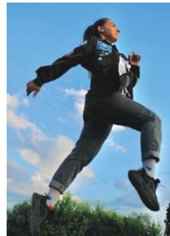
Боец строительного отряда «ЖЕНСКИЙ двигатель» на Целине.

Но ведь не одной учёбой жив студент. В Сибстрине каждый может найти себе дело по душе: действуют творческие и спортивные коллективы, семь